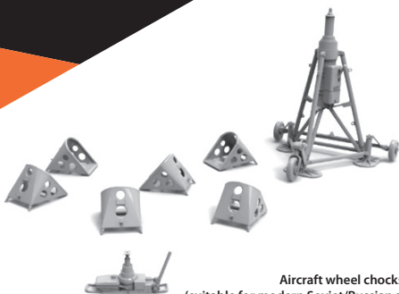
Aircraft wheel chocks, jacks (suitable for modern Soviet/Russian aircraft)

To attach resin parts use cyanoacrylate glue. Для склеивания деталей использовать цианоакрилатный клей