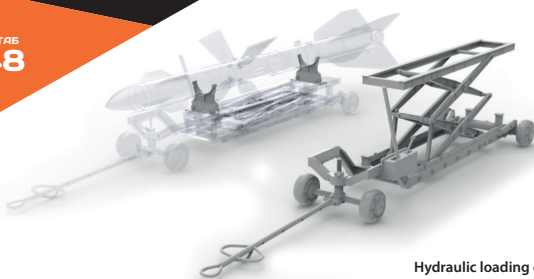
Hydraulic loading cart (suitable for modern Soviet/Russian aircraft)

To attach resin parts use cyanoacrylate glue. Для склеивания деталей использовать цианоакрилатный клей