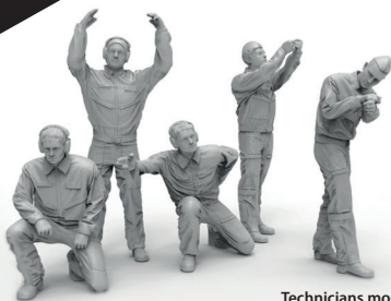
Technicians modern Russia Air Force

To attach resin parts use cyanoacrylate glue. Для склеивания деталей использовать цианоакрилатный клей