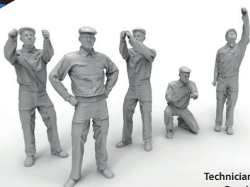
Technicians modern Russia Air Force

To attach resin parts use cyanoacrylate glue. Для склеивания деталей использовать цианоакрилатный клей