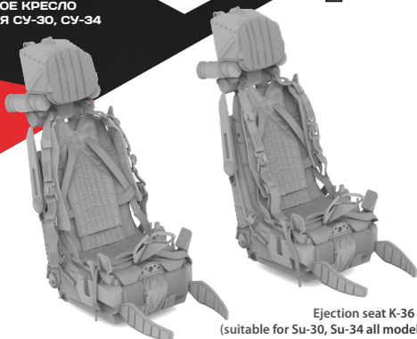
Ejection seat K-36 D 3.5 (suitable for Su-30, Su-34 all model kits)

To attach resin parts use cyanoacrylate glue. Для склеивания деталей использовать цианоакрилатный клей