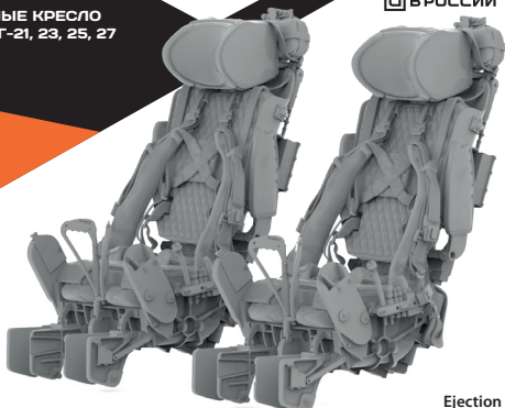
Ejection seat KM-1 (suitable for MIG-21, 23, 25, 27 all model kits)

To attach resin parts use cyanoacrylate glue. Для склеивания деталей использовать цианоакрилатный клей