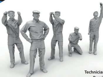
Technicians modern Russia Air Force

To attach resin parts use cyanoacrylate glue. Для склеивания деталей использовать цианоакрилатный клей